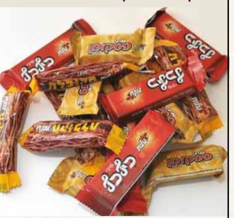
לא רק מדעים: כבר נכשיו המדעים על עליית מיזורים ללא אבקת חלב נוכרי. העדכון יופיע על האריות החדשות